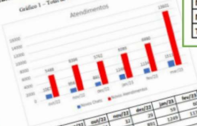
Gráfico 1 – Total de Novos Chats e Novos Atendimentos